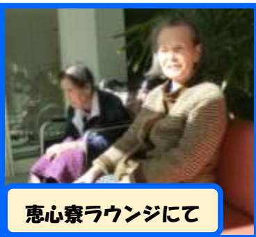
恵心寮ラウンジにて