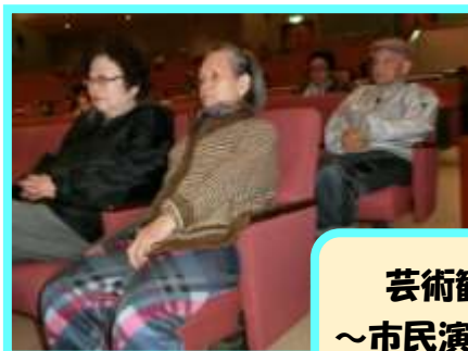
芸術観賞 ～市民演芸会～